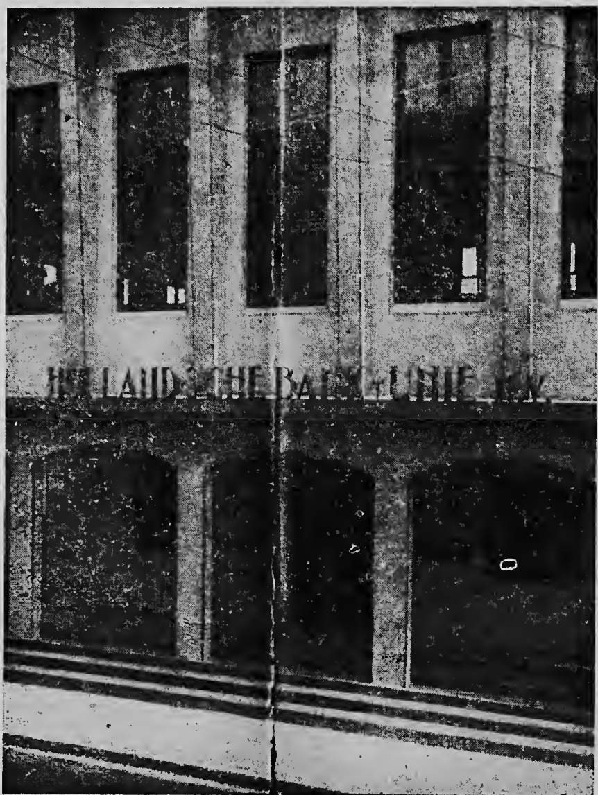
DIT IS het kantoor van de Hollandse Bank Unie te Oranjestad.

Uit de aard der zaak bestaat op ons eiland de meeste belangstelling voor het overzicht van de Nederlandse Antillen en derhalve zullen we daaruit voor dit artikel in hoofdzaak putten.